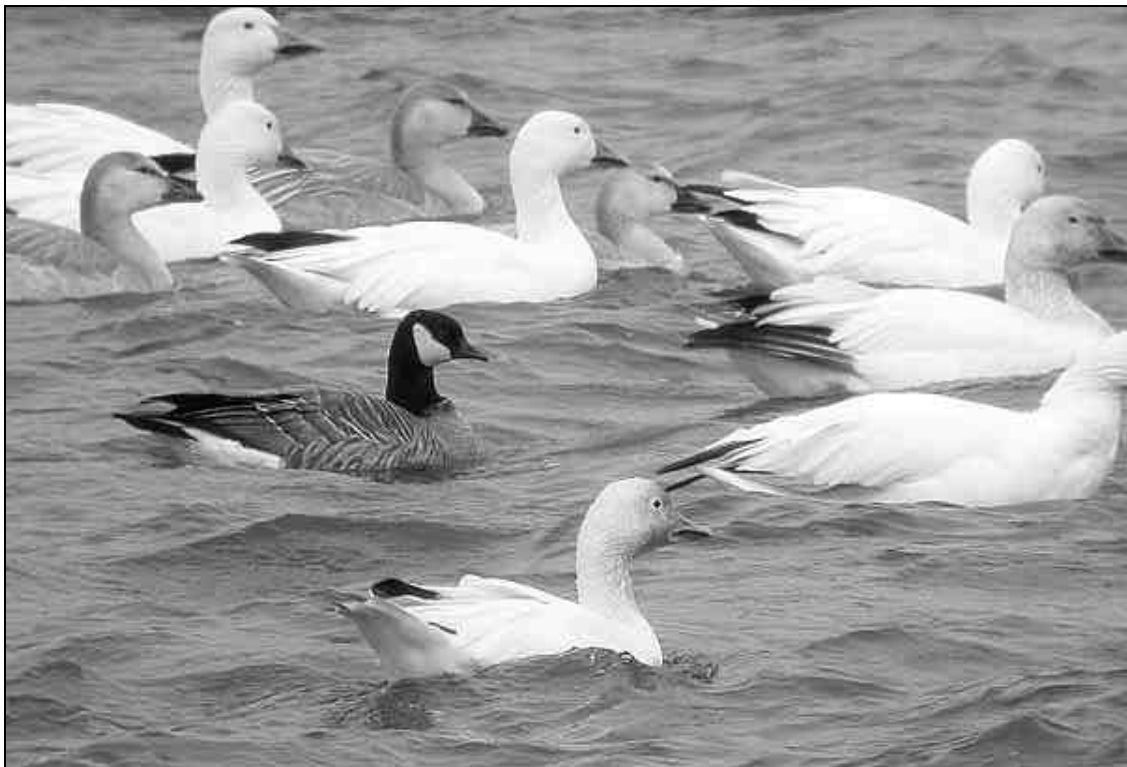
25 octobre 2003

Bernache du Canada de la sous-espèce hutchinsii ( Branta canadensis hutchinsii ) observée à Saint-Jean-sur-Richelieu