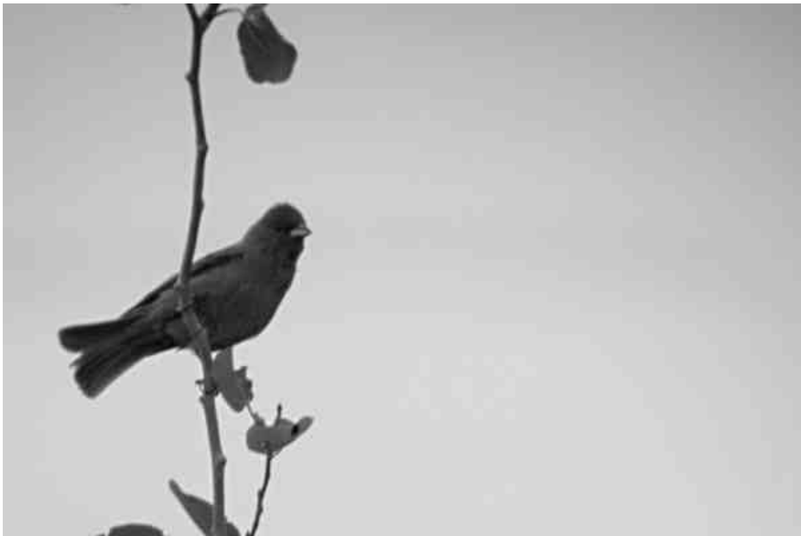
19 juillet 2003

Passerin indigo ( Passerina cyanea ), observé au mont Saint-Grégoire