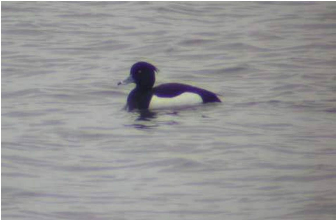
27 avril 2003

Fuligule morillon ( Aythya fuligula ), observé à Venise-en-Québec